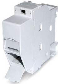
REG-Adapter für 1 RJ45 Modul MS-C6A 1/8 Cat.6A (IEC) 180°-K (Keystone)