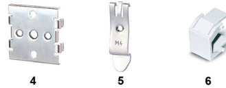
4-5 Adapterplatten für Tragschienenbefestigung 6 Blindabdeckung